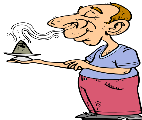
Gott - das bin ICH