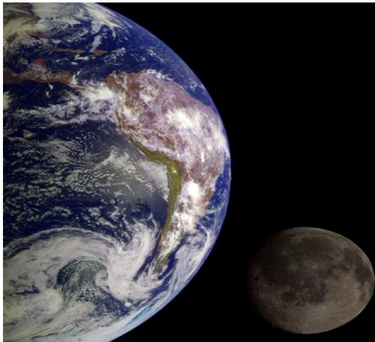
Raumsonde Galileo: Vorbeiflüge an Mond und Erde im Dez. 1992