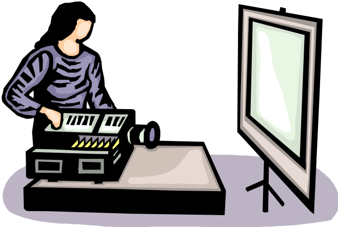
Gott als Projektion der Menschen (Atheismus)