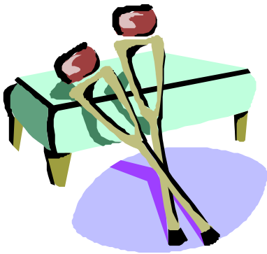
Gott als psychologische Krücke