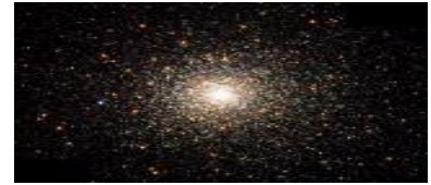
Gott – nur unpersönliche Energie oder persönlicher Schöpfer?