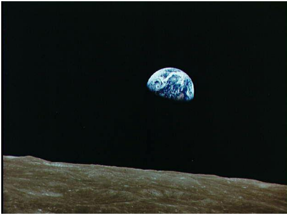
Aufgang der Erde von der Mondoberfläche aus gesehen